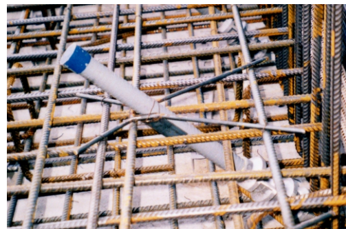
"Hercules" EsB mit Halterung 45°

Die schlanke Verankerung läßt sich im Gegensatz zu bisher verwendeten Plattenankern u. dergl. leicht und schnell durch enge Bewehrungslagen führen - deshalb Einbau in kürzester Zeit ! -